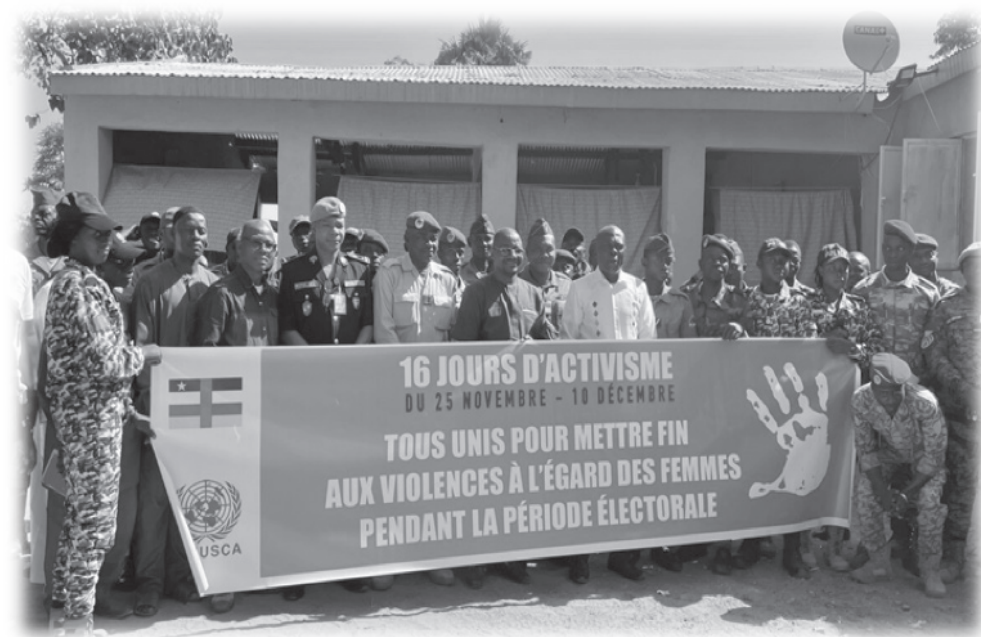
Tenuta a Birao (prefettura della Vakaga) di un workshop con membri delle Forze armate e dell'ordine locali, sull'attivismo contro la violenza sulle donne 128

In ottobre 2024 a Bangui è stata organizzata una serie di workshop di sensibilizzazione per comandanti di corpo d'armata, ufficiali, sottufficiali e soldati semplici delle Forze armate centrafricane (FACA) sulla prevenzione e la gestione delle molestie e della violenza di genere nell'ambiente militare. Si tratta di un'iniziativa del Ministero della Difesa Nazionale che ha ricevuto il sostegno della MINUSCA 127 .