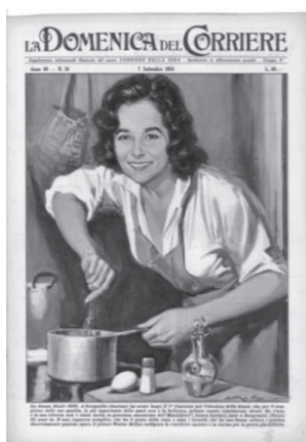
Copertina di “La Domenica del Corriere” del 7 settembre 1958 100

Il cambiamento “culturale” è testimoniato anche da altre pubblicità che, benché non basate su doppi sensi, in passato hanno relegato la donna alla funzione di moglie e madre, dedita interamente alla famiglia e alla casa; funzione che rispecchiava la società del tempo, ma solo parzialmente, dato che la donna lavoratrice (fuori casa) non era affatto una rarità.