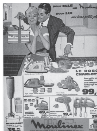
Pubblicità dell’azienda “Moulinex” del 1961 101