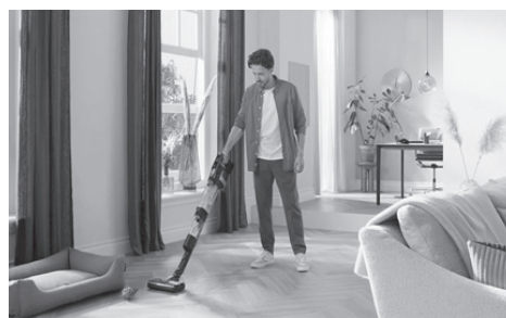
Pubblicità aspirapolvere e lavapavimenti senza fili Philips Aqua Trio 9000 103

Per muoversi ulteriormente in questo senso, è stato coniato, nel 2014, il termine “Femvertising”, nato dalla fusione delle parole inglesi “female” (femminile) e “advertising” (pubblicità), indicante una strategia pubblicitaria che promuove l’empowerment femminile e la parità di genere.