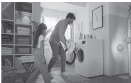
Fermo immagine dello Spot TV 2023 di Dixan Pulito profondo 102

Oggi, però, sta prendendo sempre più piede, anche nelle pubblicità, la figura della “donna lavoratrice”, affiancata spesso da uomini che invece si occupano delle faccende domestiche e dei figli; passo dopo passo, spot dopo spot , i brand si stanno muovendo in questa direzione.